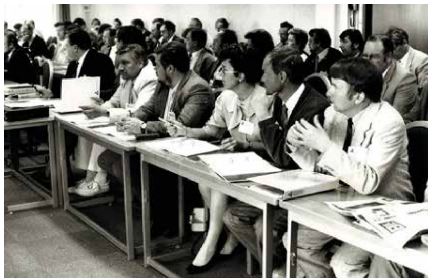
Stadsstyrelsernas ordförande 8–9.5.1990 i Heinola.

Efter valet 2017 är 39 procent av fullmäktigeordförandena kvinnor. Andelen kvinnor ökade med 11 procentenheter jämfört med föregående fullmäktigeperiod. Andelen har ökat stadigt från år 1993, då andelen kvinnliga fullmäktigeordförande var 16 procent.