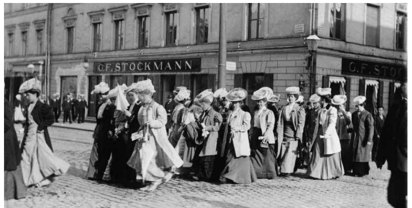
Kvinnorna demonstrerar eventuellt för rösträtt 1905.

Borgarståndet representerade fram till år 1879 stadens skattebetalande borgare och andra privilegierade yrkesutövare. Efter att det gamla skräväsendet upphävdes fick alla stadens skattebetalande manliga invånare – med vissa undantag – som inte hörde till annat stånd rätt att delta i borgarståndets val. På samma sätt som i kommunalval var rösträtten bunden till skatteörena också i borgarståndets val av representanter.