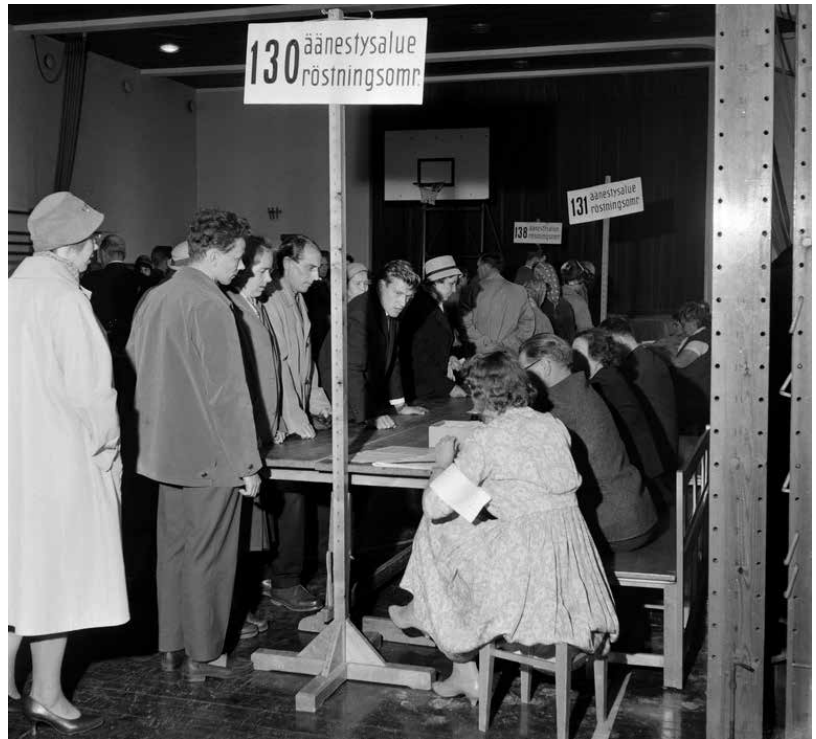
Kommunalvalet 2.10–3.10.1960. Herttoniemen kansakoulu.

årliga rotationen men mandattiden var alltså tre år. Den fyraåriga mandattiden infördes i mitten av 1950-talet.